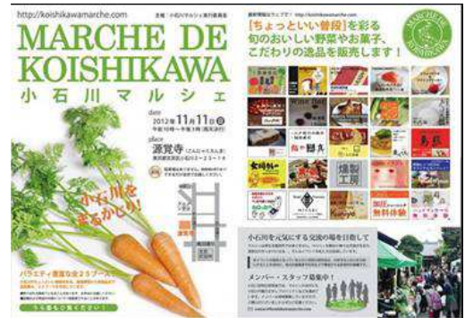
チラシのイメージ