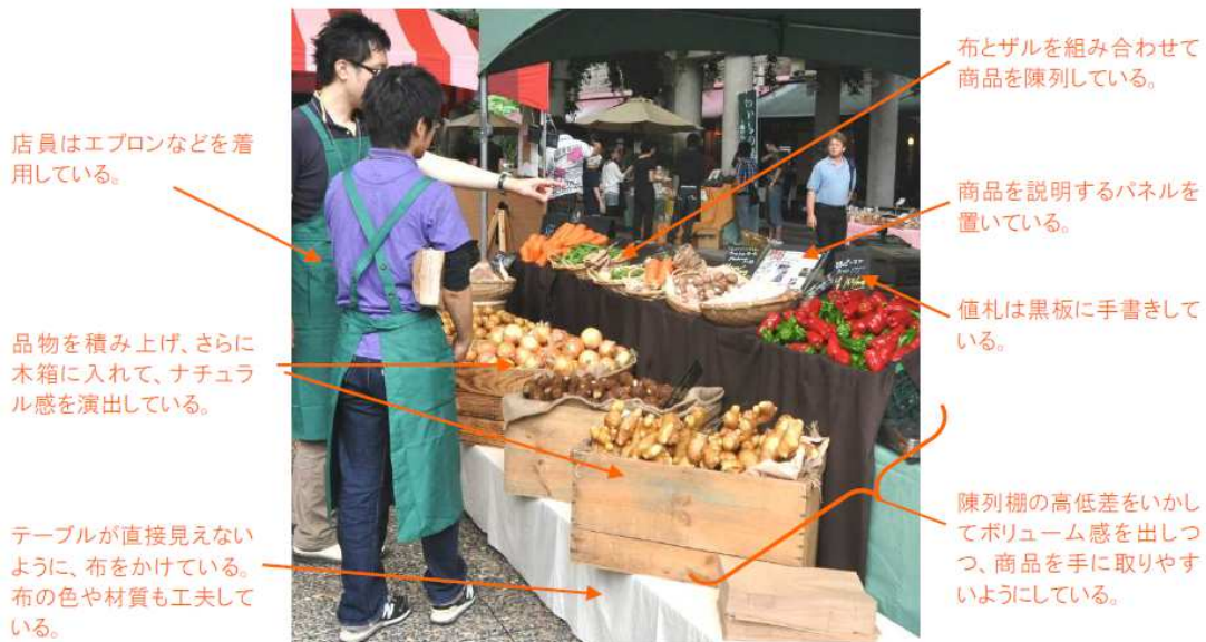
第4回マルシェ(2012.11.11(日)曇のち雨 来場者数:1820人【実行委員会集計】 出店者数:25店舗)