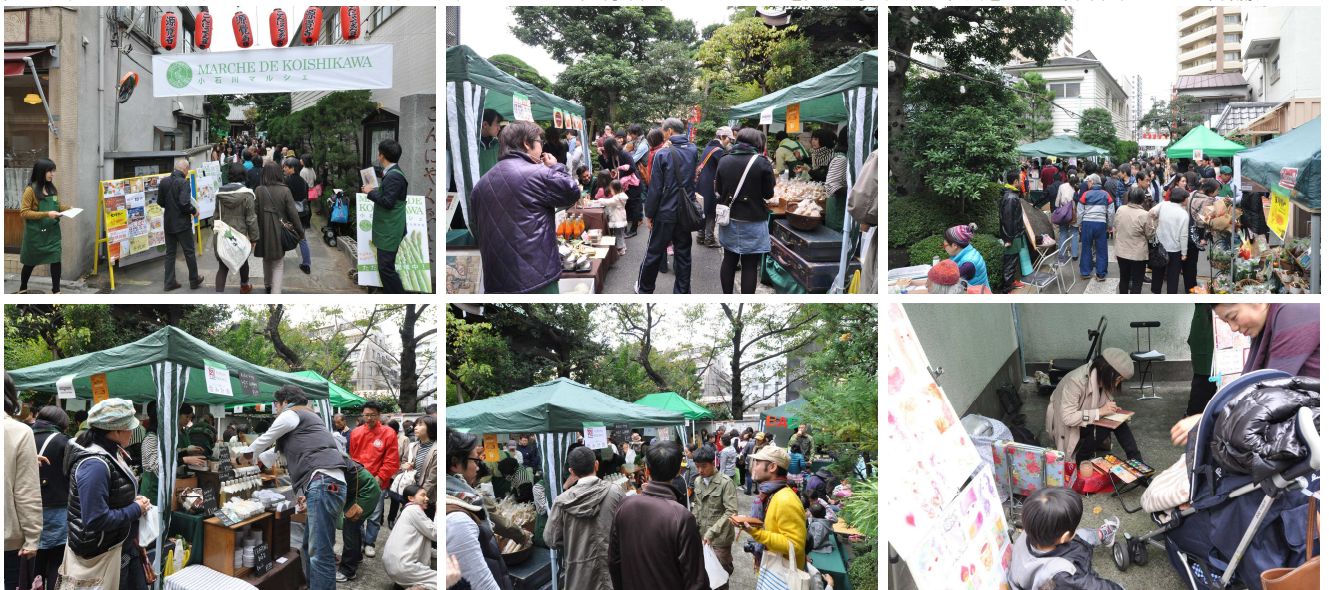
参考:第1回マルシェ(2011.6.5(日)快晴 来場者数:648人【実行委員会集計】 出店者数:6店舗)