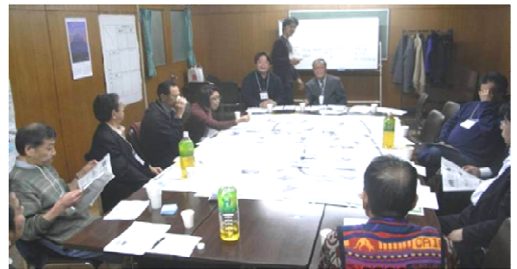
小石川活性化研究会(小石川マルシェ実行委員会の母体組織)での検討の様子

私たちは、まず小石川の街を分析し、続いて街を元気にする方策を時間をかけて検討しました。その結果次のようにまとめられました。