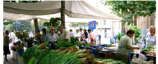
ヨーロッパの都市では、休日になると広場で大小さまざまな市がたちます。

マルシェとは「市場」という意味のフランス語です。ヨーロッパで休日に日用品を販売する市をイメージして、本イベントを「小石川マルシェ」と命名しました。