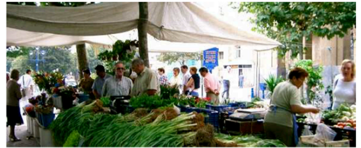
ヨーロッパの都市では、休日になると広場で大小さまざまな市がたちます。

マルシェとは「市場」という意味のフランス語です。ヨーロッパで休日に日用品を販売する市をイメージして、本イベントを「小石川マルシェ」と命名しました。