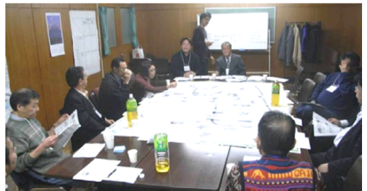
小石川活性化研究会(小石川マルシェ実行委員会の母体組織)での検討の様子

私たちは、まず小石川の街を分析し、続いて街を元気にする方策を時間をかけて検討しました。その結果次のようにまとめられました。